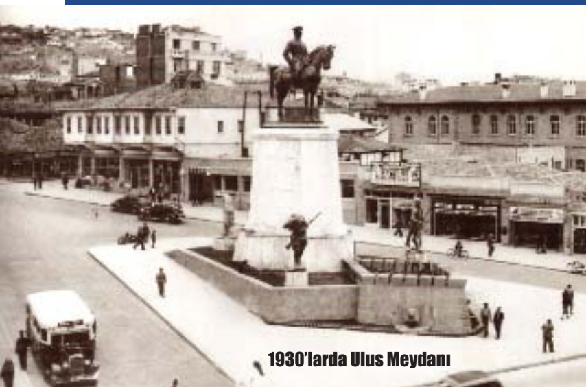
1930'larda Ulus Meydanı

Ulus ve Anafartalar iş merkezleri ile Ulus Hali 9 ayrı gayrimenkul karşılığı Büyükşehir'e verildi