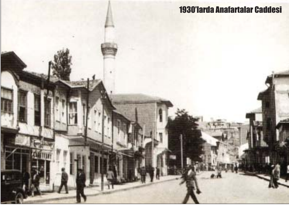
1930'larda Anafartalar Caddesi

BAŞKAN GÖKÇEK: "EGO'NUN YERİNİ HABERİMİZ OLMADAN ALMIŞLAR"