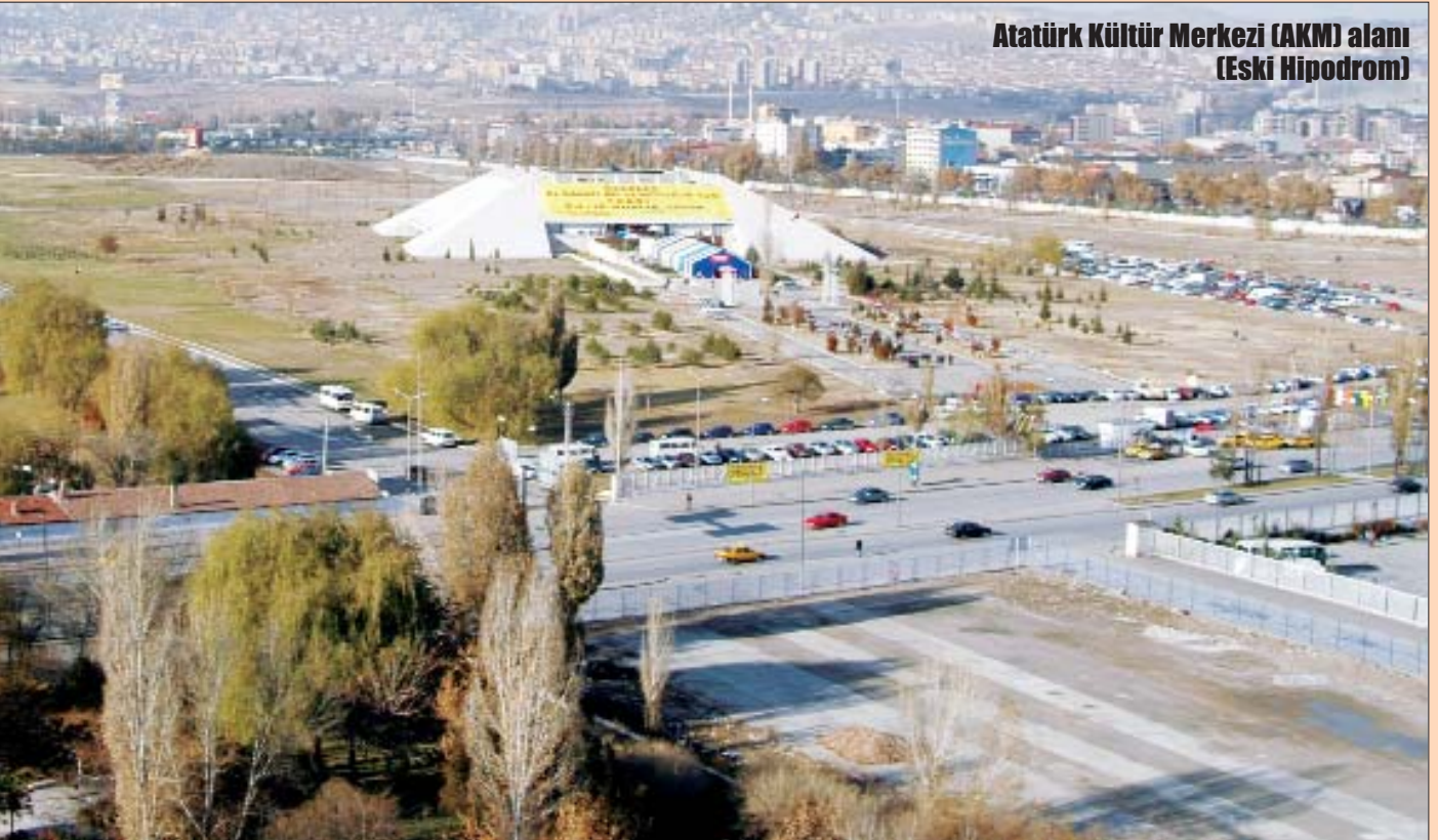
Atatürk Kültür Merkezi (AKM) alanı (Eski Hipodrom)

Çevre ve Şehircilik Bakanı İdris Güllüce ise yaptığı konuşmada milletin temelinin kültür olduğunu belirterek, "Bu alanda bu milletin kültürünün yansımaları lazım" dedi.■